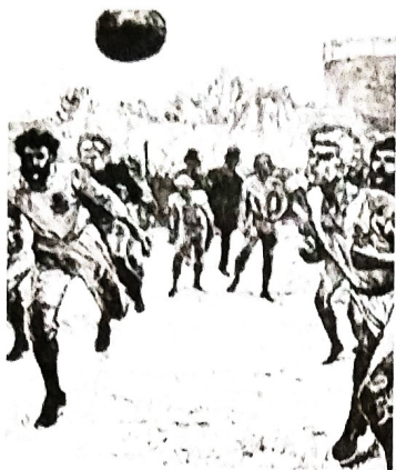
Англия мен Шотландия арасындағы матч, 1872 жыл

Футбол тарихы XII ғасырдан басталады. Алғаш рет Англияда дамыды. Саяхатшы Гастон де Фуа өз заманында футболды бар ынтасымен бақылап, « Ағылшындар футболды ойын деп есептесе, онда төбелесті не дейді? » деп жазып кеткен екен. Футболға қарсылық көрсеткендер болды. Мысалы, шіркеудегі діндарлар, феодалдар футболға тыйым салынуын талап еткен екен. Өйткені, бүгінгі күнге дейін футбол өте қауіпті ойын саналып келеді.