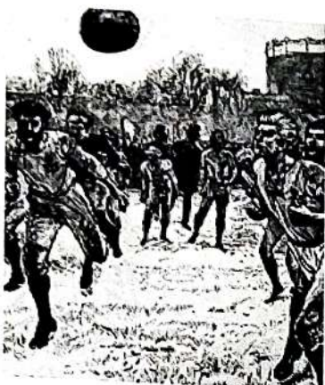
Англия мен Шотландия арасындағы матч, 1872 жыл

Футбол тарихы XII ғасырдан басталады. Алғаш рет Англияда дамыды. Саяхатшы Гастон де Фуа өз заманында футболды бар ынтасымен бақылап, « Ағылшындар футболды ойын деп есептесе, онда төбелесті не дейді? » деп жазып кеткен екен. Футболға қарсылық көрсеткендер болды. Мысалы, шіркеудегі діндарлар, феодалдар футболға тыйым салынуын талап еткен екен. Өйткені, бүгінгі күнге дейін футбол өте қауіпті ойын саналып келеді.