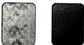
сары карточка мен қызыл карточка

Ойын шарттарын бұзушылықты фол деп атайды. Бірінші рет тәртіп бұзған үшін - сары карточка беріледі, ал екінші қайталаған үшін - қызыл карточкамен ойыншыны ойын алаңынан шығарады.